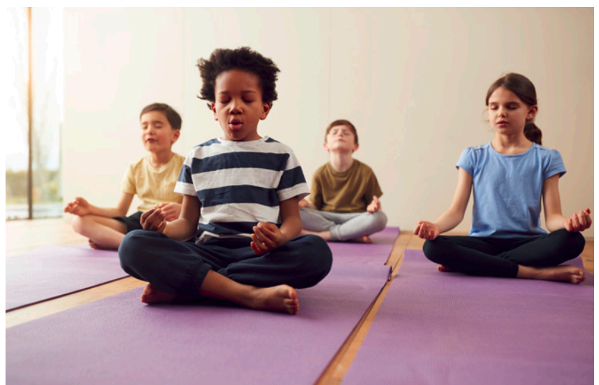
Yoga macht Schule – ein Interview Magazin, Seite 58