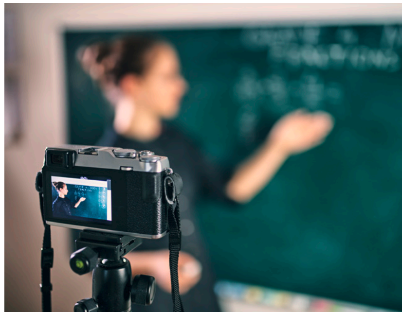
Umfrage: Der Frontalunterricht erlebt in der Coronakrise ein Revival Magazin, Seite 60